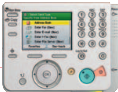
Le grand écran TFT couleur 3,5 pouces (8,9 cm) et la molette de navigation assurent un accès facile à toutes les fonctions.

Les documents peuvent être numérisés en de nombreux formats numériques dont un format "PDF compact" très pratique qui utilise la technologie de haute compression développée en exclusivité par Canon. Ceci permet d'obtenir des fichiers PDF de haute qualité, adaptés à un partage via la fonction ENVOI.